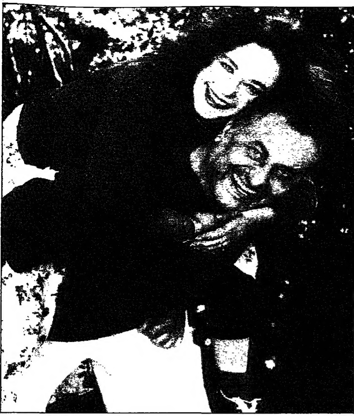
الممثل الأردني نيل صوالحة ابنة جوليا على ظهره